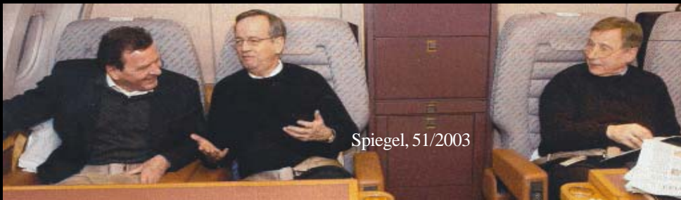
Siemens-Chef Pierer und seine Abteilungsleiter Schröder und Clement.