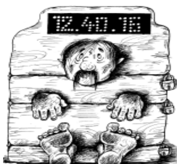
„Förderung“ der Arbeitsaufnahme