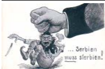
Postkarte aus dem I. Weltkrieg

Mit dem rechtswidrigen Angriff auf Jugoslawien, sind wir auf dem besten Weg unsere „ruhmreiche“ und kriegerische Tradition wiederaufzunehmen. „Serbien muß sterben“ hieß es im I. Weltkrieg. Diese Parole gilt heute noch und war gleichzeitig der Auftakt dafür,