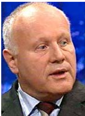
Georg Milbradt (CDU) ist seit 2002 Ministerpräsident Sachsens. Er war bis 2001 Finanzminister im Kabinett Biedenkopf. Interview

„Die CDU muss Werte wie Vaterlandsliebe pflegen“