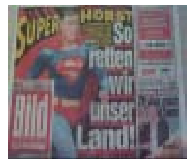
BILD vom 16. 3. 05.

Obendrein hat er es den „Großen“ in Politik und Wirtschaft gegeben. In der Sprache des Volkes, wie sie bei BILD gesprochen wird, hat er furchtlos und unparteiisch Klartext geredet. Alle haben sie ihr Fett abbekommen.