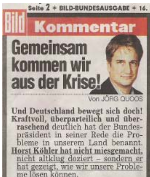
BILD vom 16. 3. 05.