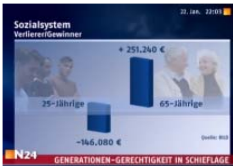
Volck: Die Wahrsager

„Schlechte Nachrichten für alle Deutschen unter 45 Jahren, sie zahlen in ihrem Berufsleben mehr ins soziale Berufsleben ein, als sie in späteren Jahren als Rentner wieder zurückbekommen. Umgekehrt erhalten unsere heutigen Rentner weitaus mehr als sie eingezahlt haben. Da kann es zwischen den Generationen noch richtig Krach geben.“ N 24