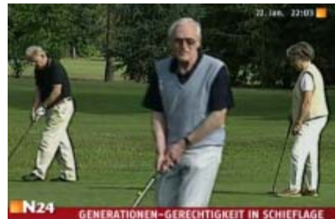
So stellen die Hacker Rentner dar.