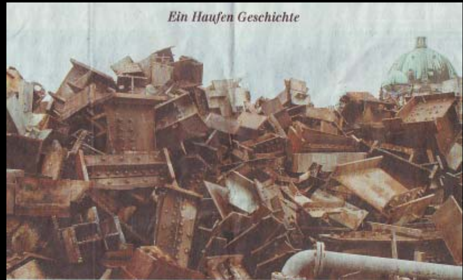
Ein Haufen Geschichte