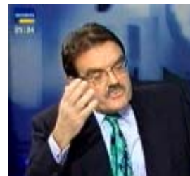
Hugo Müller-Vogg (Die Welt)

„ Aber es zeigt sich die historische Wahrheit: die Sozialdemokraten sind am ehesten in der Lage, die notwendigen sozialen Einschnitte vorzunehmen! “