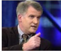
Horst Seehofer: (Stellv. CDU/CSU- Fraktionsvorsitzender)

Die Rentner leben nicht von den Beitragszahlern sondern von deren Arbeitsergebnissen. Sie sind ja keine Kannibalen!