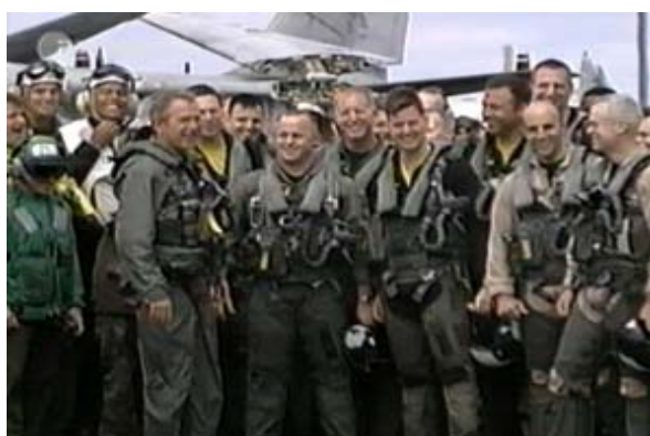
Die Metzgermeister und ihre Jungs, die einen guten Job machen.

So reizvoll dieses Wortspiel auch ist, ganz korrekt ist es nicht. Der Metzger führt Schlachtvieh auf die Schlachtank, Typen wie Bush und Hitler führen Menschen auf die Schlachtbank. Im Ergebnis ist es aber gleich. Am Ende steht immer der Tod und der Profit!